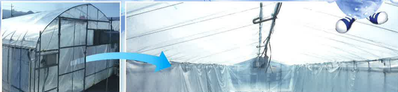
※「内張りサイド」としての使用例